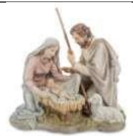
Б) Рождество Христово